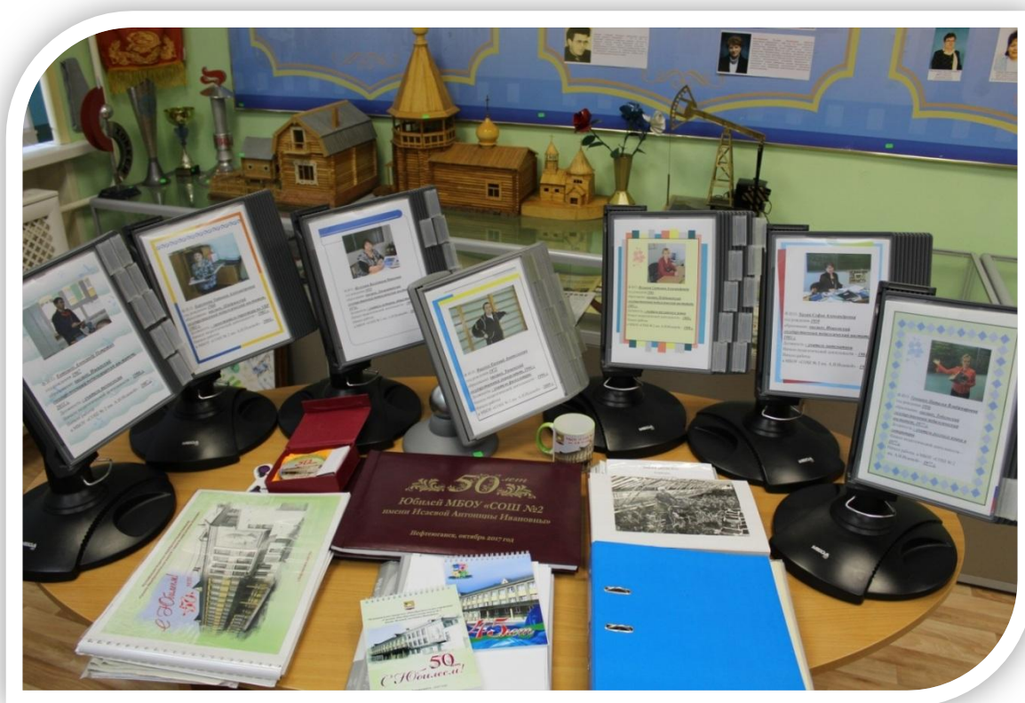
Экспозиции школьного музея.